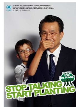
Seung Soo Han, Ancien Premier Ministre de la Corée du Sud