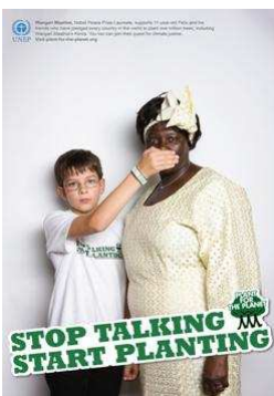
Wangari Maathai Prix Nobel de la Paix 2004

Pour cette quatrième édition, marquée par l'anniversaire des 40 ans de la Journée Mondiale de la Terre, Accor soutient « Stop Talking. Start Planting », une initiative également partenaire de la « Campagne pour un milliard d'arbres » du Programme des Nations Unies pour l'environnement. Portée par 132 enfants issus de 56 nations, cette campagne vise à sensibiliser l'opinion publique et les responsables politiques sur leur responsabilité envers les générations futures. Dans plusieurs grandes villes du monde, des hôtels du Groupe offrent à ces jeunes ambassadeurs la possibilité de se réunir librement dans des salles de conférence afin de porter leur message auprès des écoliers, des clients, des collaborateurs et des personnalités de la ville d'accueil.