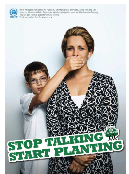
Princesse Haya Bint Al Hussein